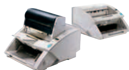
Mit Entwerter ED600